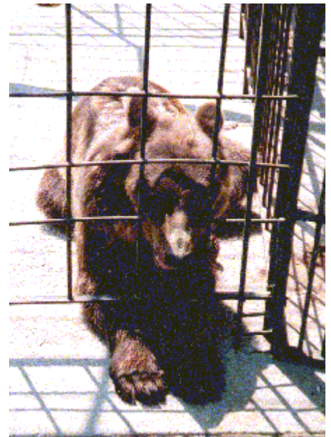
Orso bruno nello zoo di Murazzano (CN). L'animale morde continuamente le sbarre. Tale comportamento trova la sua spiegazione nell'iniziale continuo tentativo di fuggire. Diventa in seguito una nevrotica ed irreversibile abitudine.