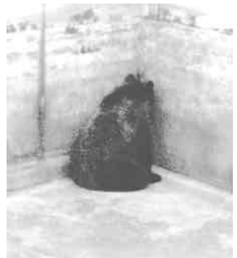
Orso bruno nello zoo di Fasano. L'animale passa il suo tempo chino sul muro del fossato. Al di sopra di esso è stato ricavato un punto di ristoro.