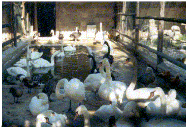
Cigni all'ammasso nello zoo privato accessibile al pubblico vicino Soliera (MO)

Non è sicuramente azzardato supporre che i "Giardini zoologici" italiani siano non meno di cento, per un totale complessivo di animali non inferiore a 10.000. Non mancano esempi clamorosi di grandi strutture aperte al pubblico e non ancora autorizzate dal Ministero dell'Ambiente per la detenzione di animali pericolosi. E' il caso dello Zoo di Napoli appartenente ad una società privata che gode, tra l'altro, di un contributo elargito dalla regione Campania per motivi didattici e dello zoo di Villa D'Orleans, ubicato nell'omonimo giardino della Presidenza