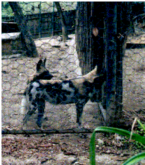
Licaoni al Bioparco di Roma. La traccia a lato dello zoccolo di cemento della recinzione è dovuta al monotono andirivieni degli animali.

Tra i vari colorati simboli ostentati dal Bioparco vi è quello dell'EPPs associato al licaone, canide africano in grave rischio di estinzione. Gli animali giunsero a Roma, tra le due guerre, quando centinaia di esemplari appartenenti a numerose specie furono ammassati in veri e propri contenitori per esseri viventi. Oggi i licaoni stabulano all'interno di recinti i quali, bene che vada, hanno un perimetro di poche decine di metri. La nascita di alcuni piccoli, fu presentata come il migliore esempio dell'impegno degli zoo nella salvaguardia di specie rare. Peccato però che le cucciolate di licaone non siano un evento raro, anzi, su 34 specie di canidi viventi (di cui 32 con accertate riproduzioni in cattività) rappresenta la sesta specie in termini di prolificità. La mortalità però è elevatissima, 70%, quasi il doppio di quella che si riscontra in natura. I piccoli spazi e l'impossibilità di stabilire la gerarchia sociale propria della specie, oltre le disfunzioni fisiologiche tipiche degli zoo, rappresentano secondo gli esperti le principali cause di morte. In natura i licaoni vivono in areali che variano, se in periodo riproduttivo o no, da 50 a